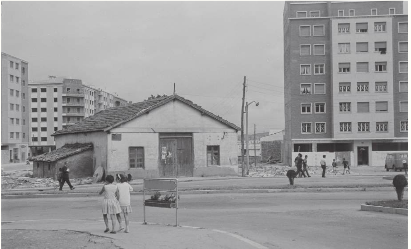
1965. Plaza de Santo Domingo: el viejo molino, Errota Zaharra , a punto de ser derribado y, detrás, la casa de Paco, que acababa de ser construida. Al fondo, el letrero de mármoles Bolumburu. Fotografía: Santiago Arina - Archivo Municipal de Vitoria-Gasteiz / LFM-444_4(2).

Un testimonio de Francisco Martínez Viñolo