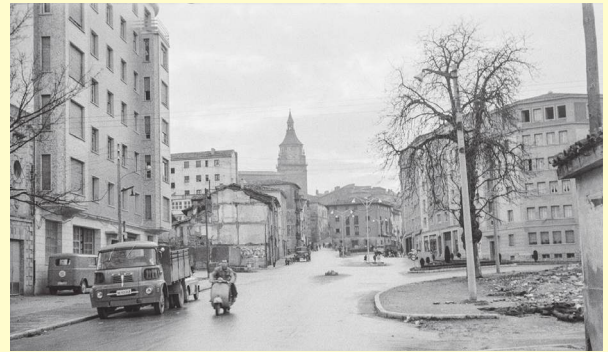
Fotografía: Santiago Arina - AMVG / LFM-319_1(6).