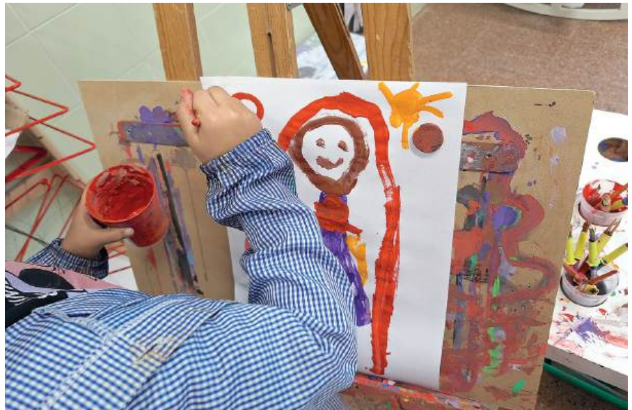
Pintura durante una actividad creativa.

O.A. La escuela es reflejo del barrio, con toda su diversidad pero evidentemente dar el paso acompañado siempre ayuda, es más fácil.