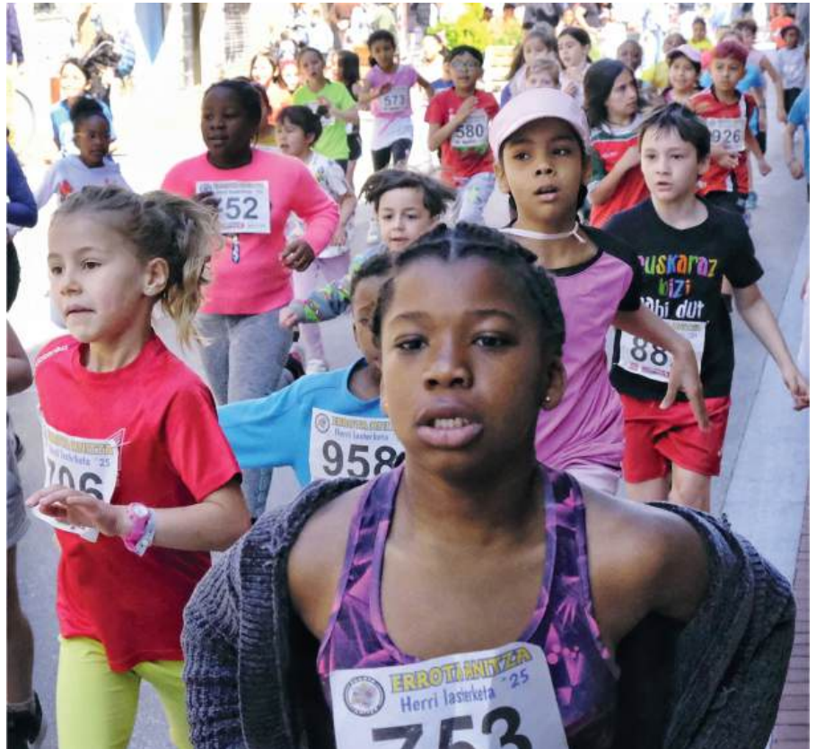
Un momento de la carrera escolar por la calle Aldabe.