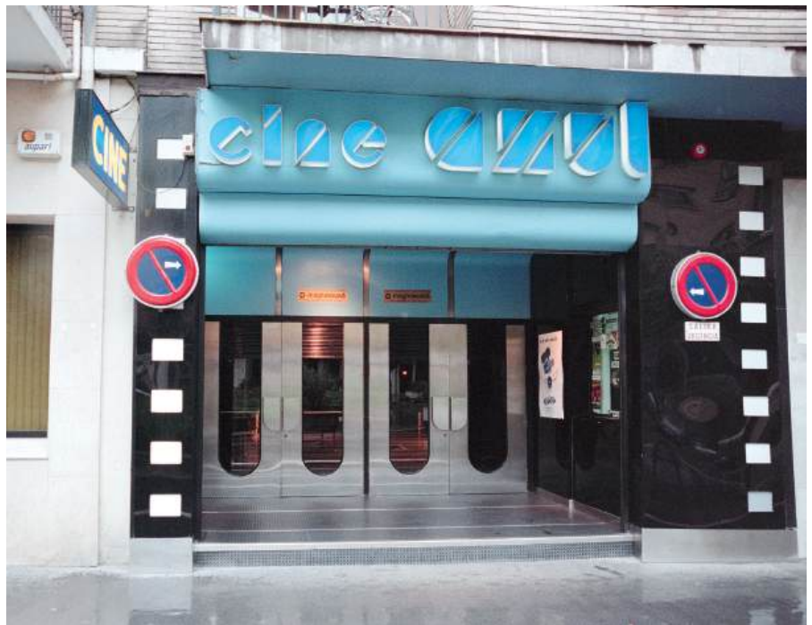
Fachada del Cine Azul en 1999.