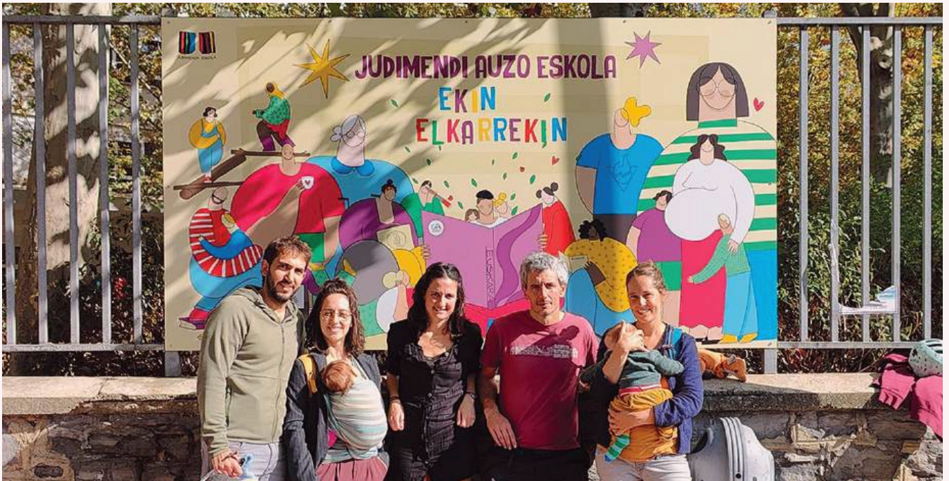
Judimendiko auzo eskolako guraso taldea.

Interesgarria iruditu zaigu, gure auzoko eskolen batuketa eta hezkuntza proiektua aztertzen ari garen honetan, egoera berdintsu batetik abiatu den eskola bateko gurasoekin mintzatzea. Eta hemen doakizue testigantza laburtu bat. Zenbait gurasok hitzegiri badute ere, guztien iritsi bateratua argitaratu dugu.