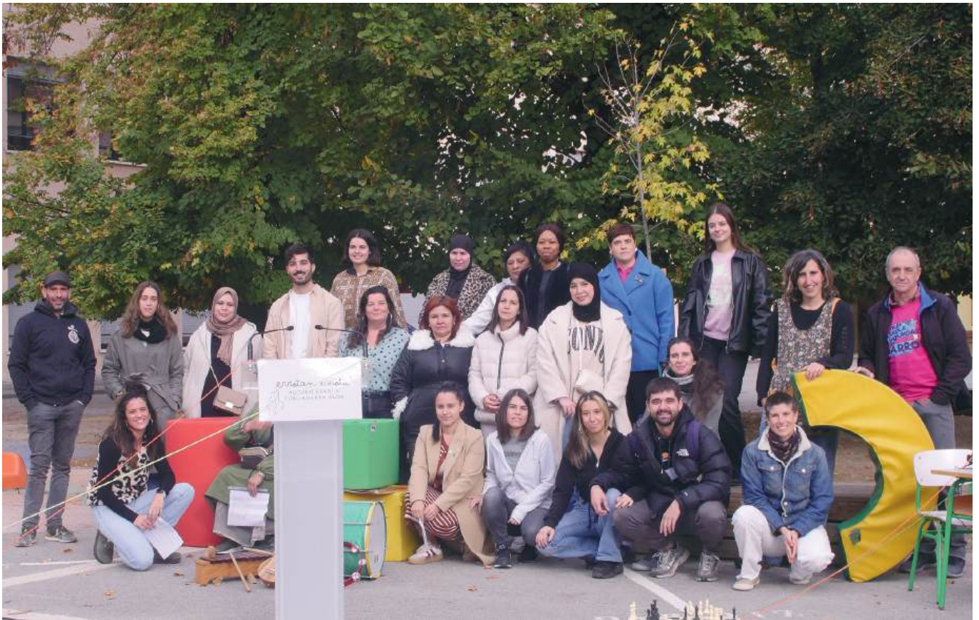
«Errotan errotuz» sarearen aurkezpena eskolako patioan.

Urriaren 29an eman zen ezagutzera Errota Eskola berria babesteko eta bultzatzeko auzoan sortu den sarea: ERROTAN ERROTUZ.