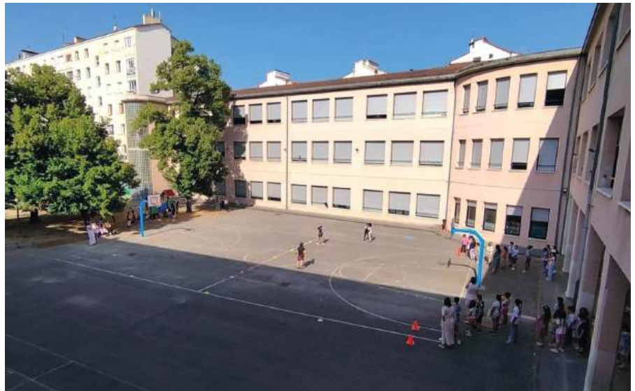
El patio de la escuela Errota.

D.C. Esta escuela está abierta a todo el barrio, y todas las personas serán bienvenidas, a partir de ahí cualquier iniciativa que sirva para avanzar fenomenal. Y la apuesta por una educación en euskara es inequívoca.