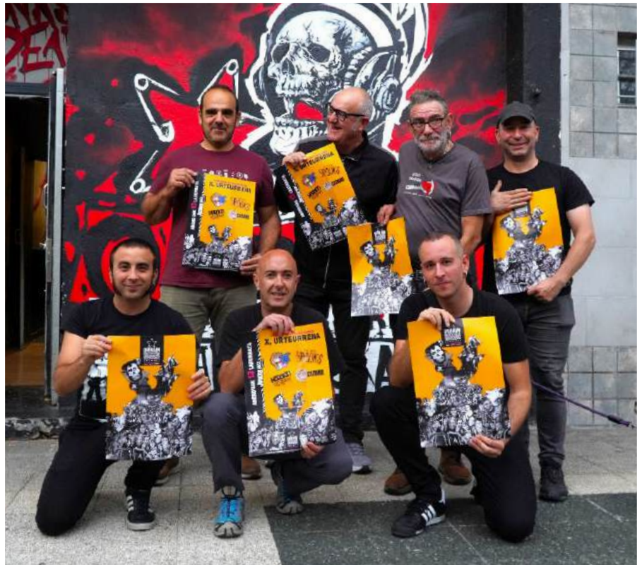
Miembros de Orbain en la presentación del X aniversario de la asociación.

Concretamente, el día 5 de diciembre, se llevará a cabo una charla